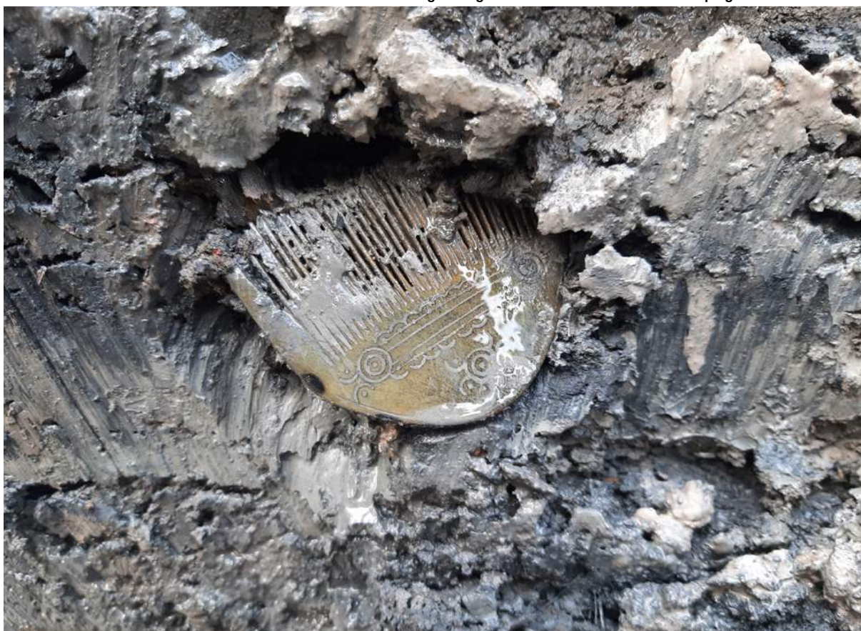
Dekorerad kam från 200-talet funnen vid utgrävningen i Skälby, Västmanland.