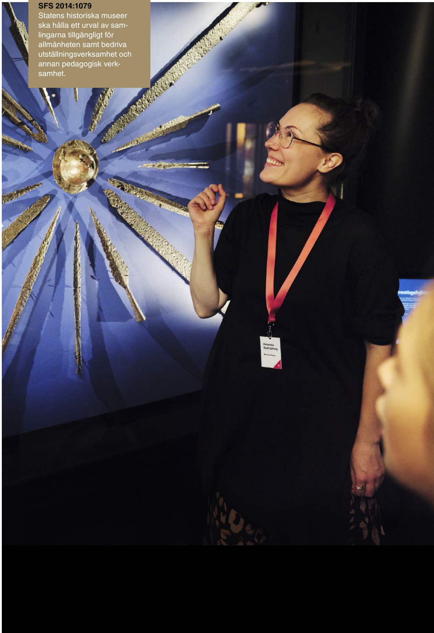
Visning i Historiska museets nya permanenta utställning Vikingarnas värld.

Statens historiska museer ska hålla ett urval av samlingarna tillgängligt för allmänheten samt bedriva utställningsverksamhet och annan pedagogisk verksamhet.