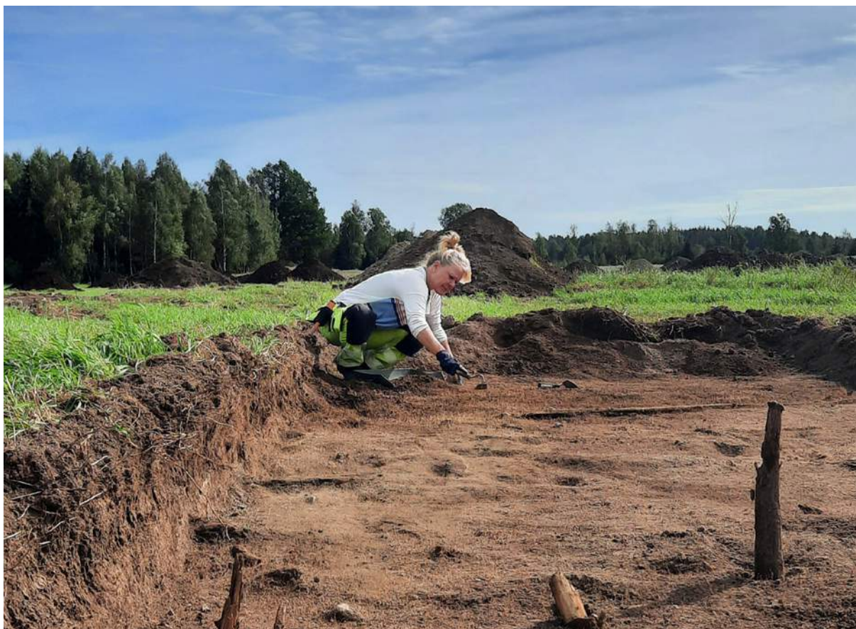
Utgrävning vid Resebromosse utanför Norrköping.