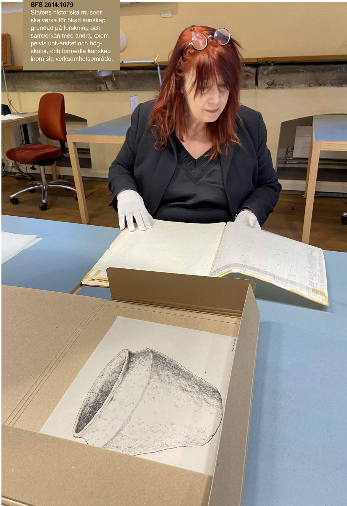
Forskare i projektet Humus economicus på jakt efter jordberättelser i arkiven.

Statens historiska museer ska verka för ökad kunskap grundad på forskning och samverkan med andra, exempelvis universitet och högskolor, och förmedla kunskap inom sitt verksamhetsområde.