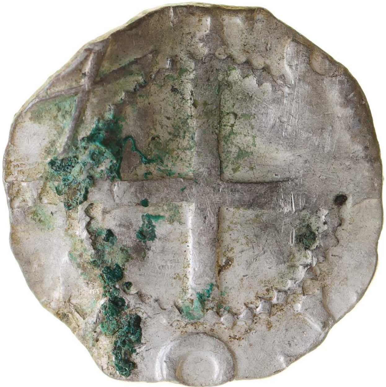
Digitaliserat mynt från Övideskatten, ett fynd som bedömts som särskilt betydelsefullt ur forskningssynpunkt.