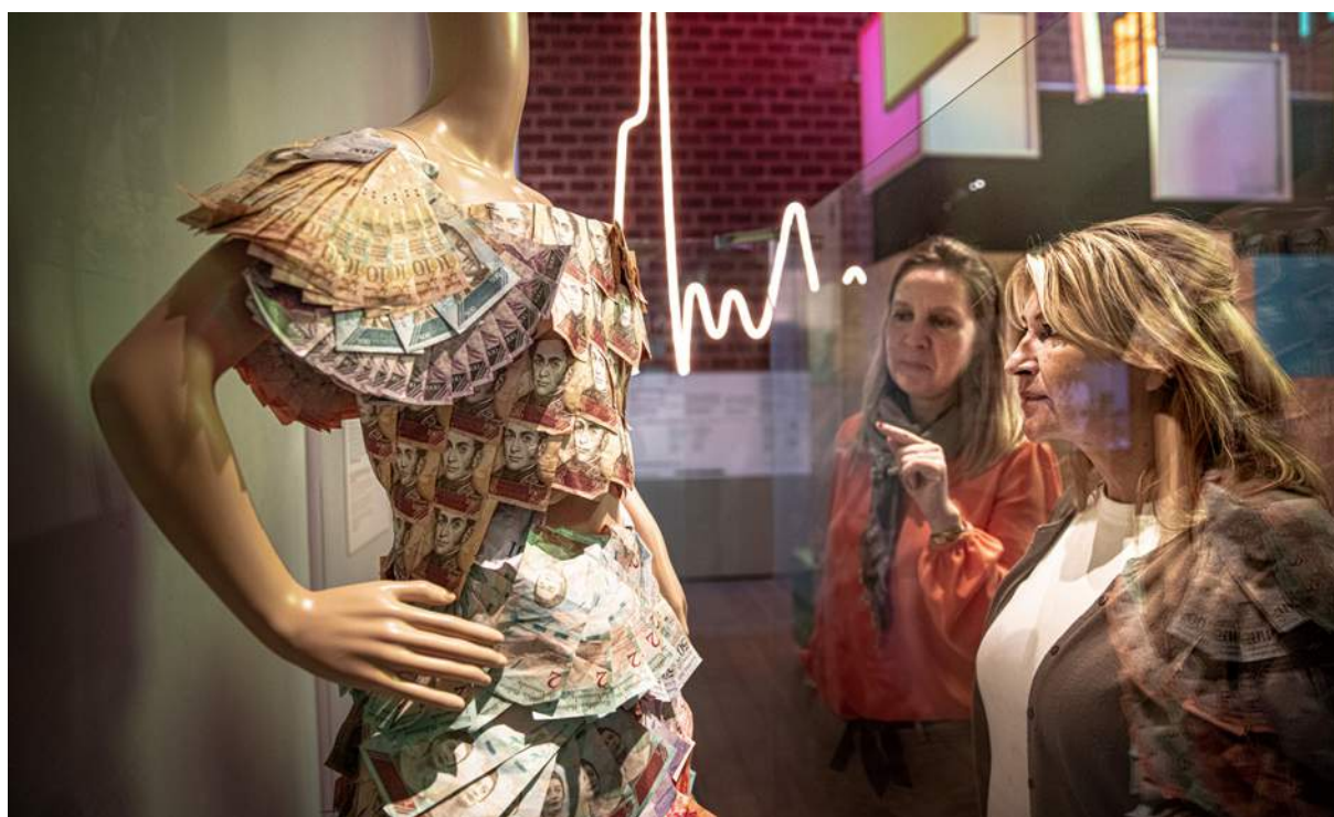
Kiänning gjord av värdelösa sedlar i utställningen Hyperinflation – ofrivilliga miljonärer och värdelösa pengar .