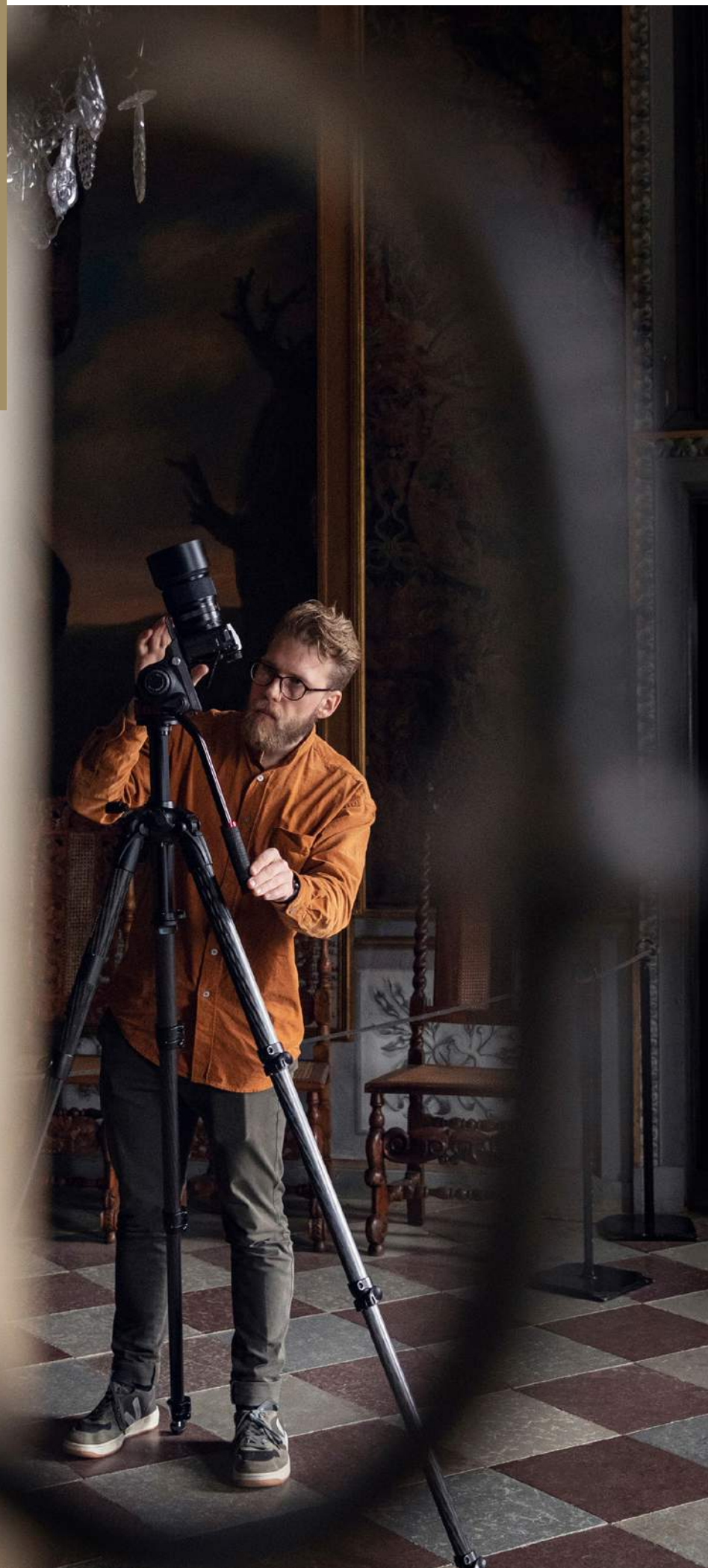
Dokumentation av föremål och miljöer på Skoklosters slott.

Statens historiska museer ska stödja regionala och lokala museer inom sitt verksamhetsområde, bedriva internationellt och interkulturellt utbyte och samarbete. Myndighetens samverkan med myndigheter och andra aktörer ska omfatta det civila samhällets organisationer. Vidare får myndigheten tillhandahålla varor samt åta sig att utföra undersökningar, utredningar och andra tjänster inom sitt verksamhetsområde.