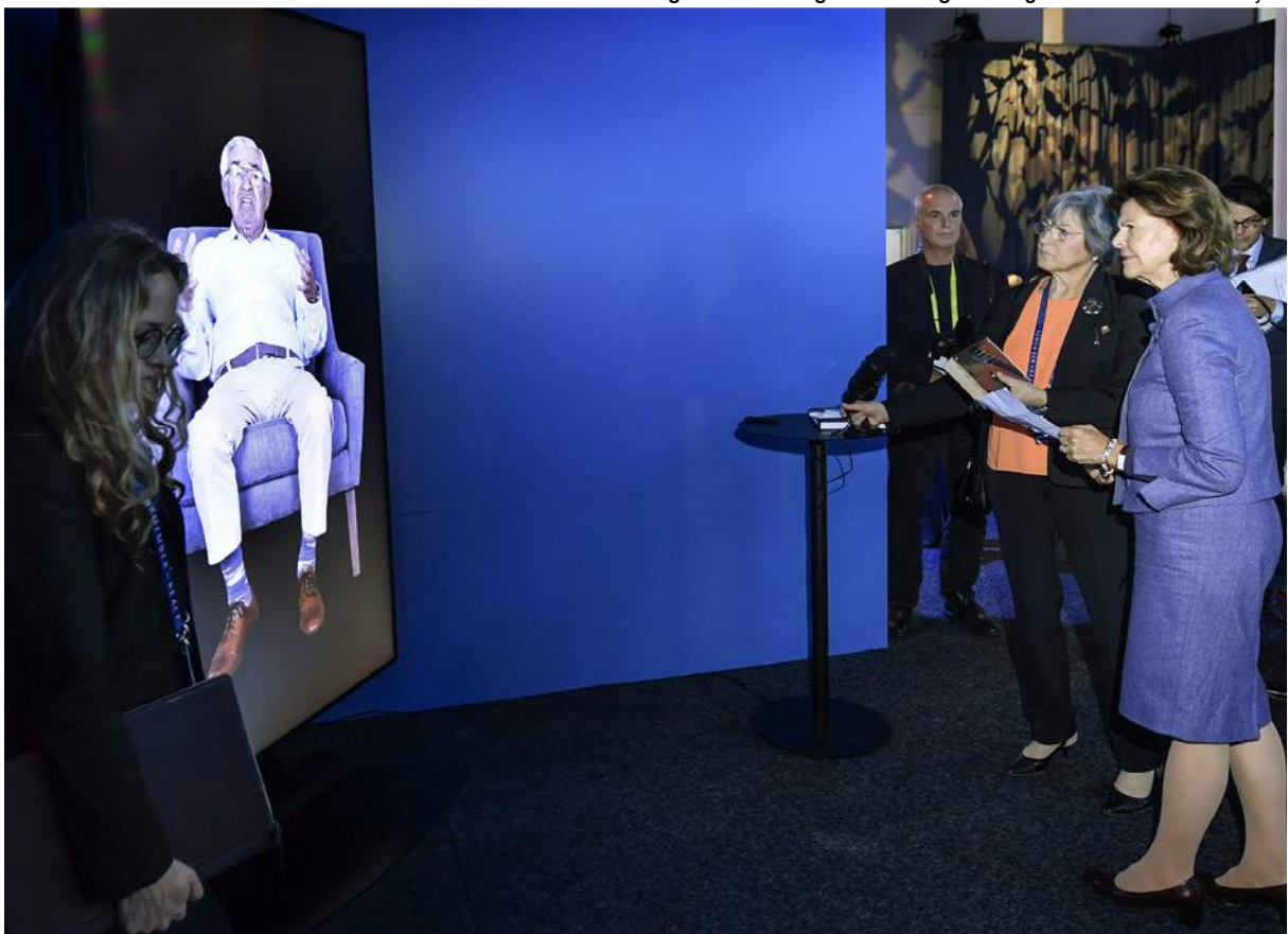
Dimensions in Testimony vid Malmö International Forum on Holocaust Remembrance and Combating Antisemitism.