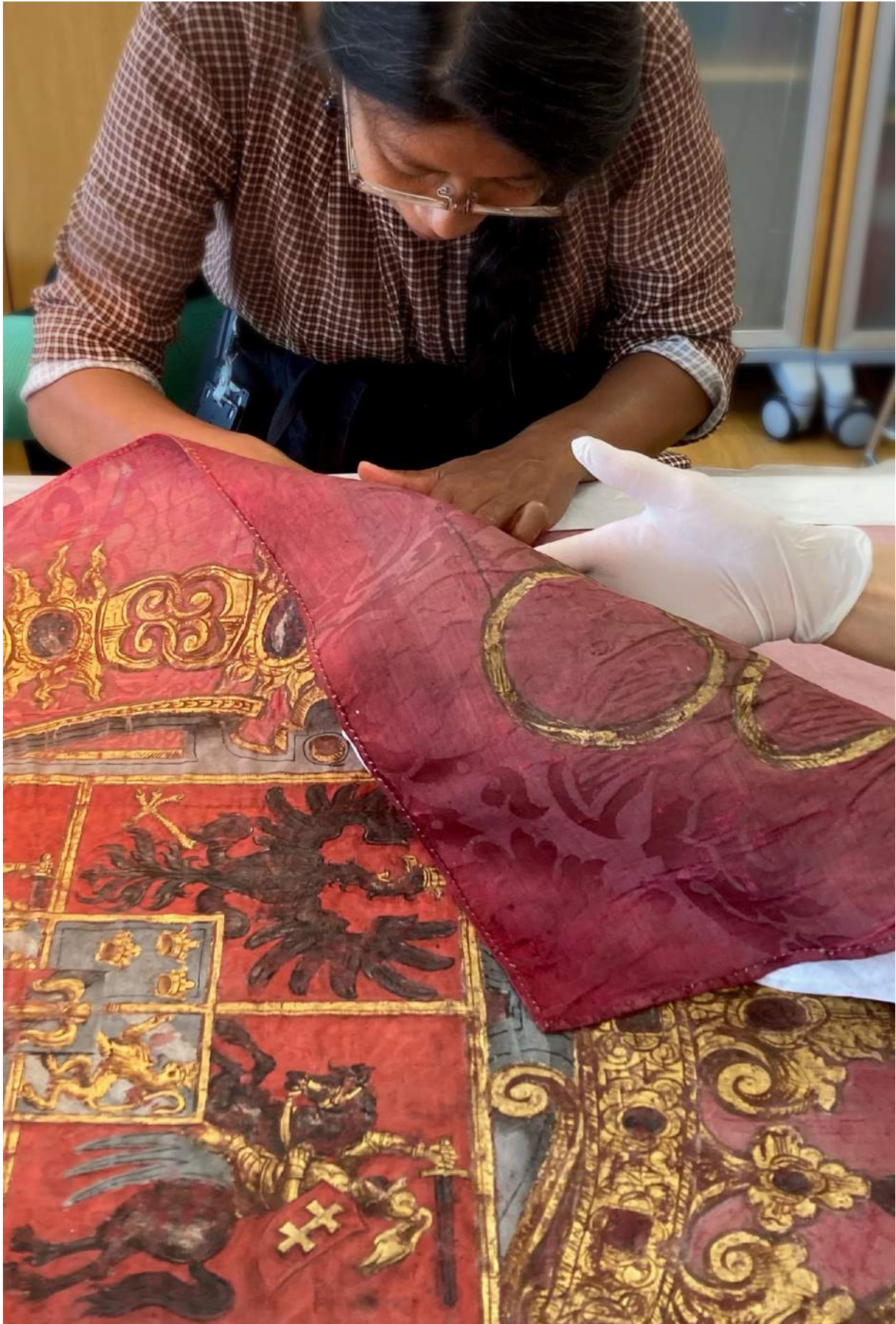
Trumpettfana från kung Sigismunds intåg i Krakow 1605 åtgärdas inför utlån till Polen.