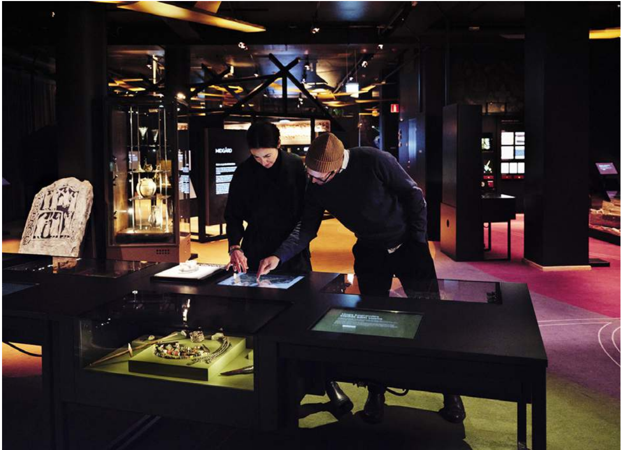
Digitalt och analogt i utställningen Vikingarnas värld .