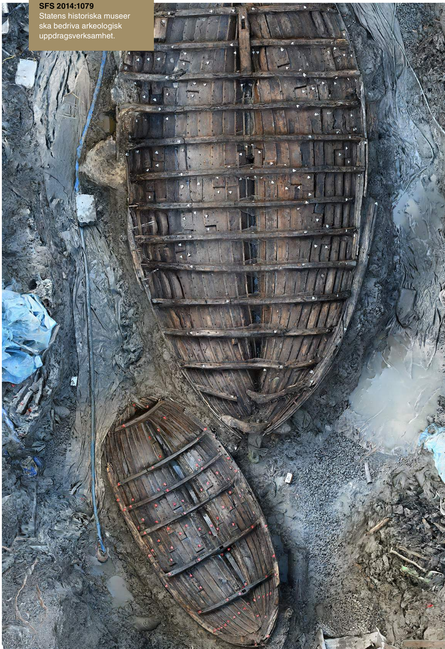
Skepp funna i Masthamnen vid Kvarnberget i Göteborg.

Statens historiska museer ska bedriva arkeologisk uppdragsverksamhet.