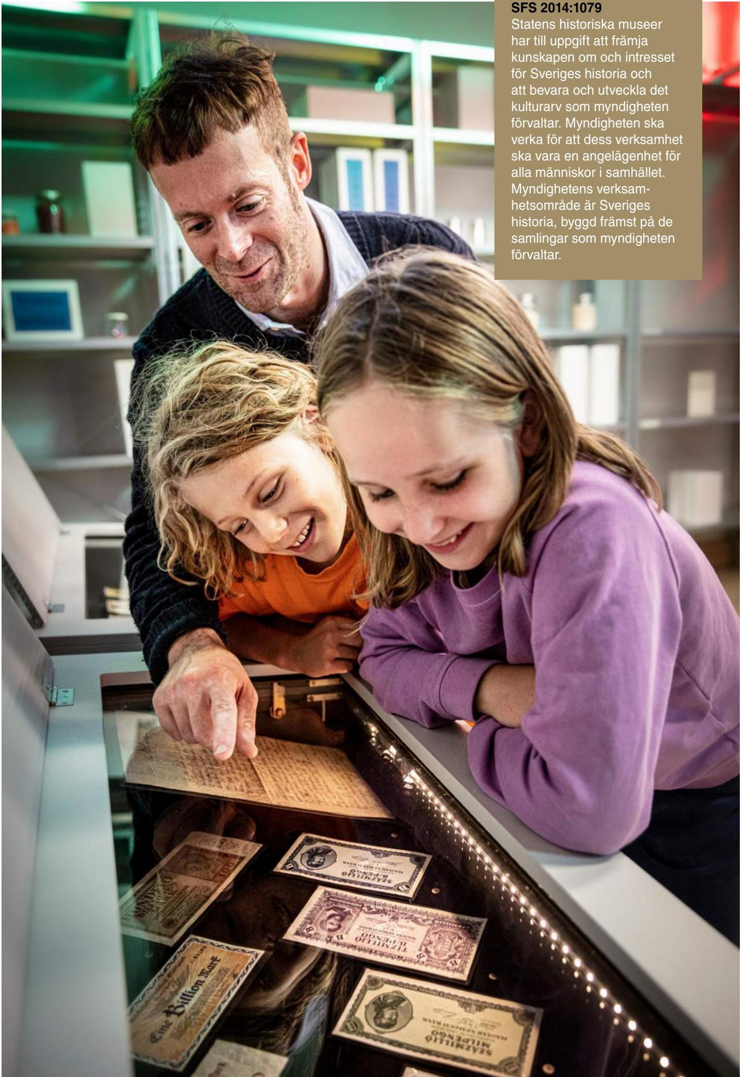
Ekonomiska museets utställning Hyperinflation – ofrivilliga miljonärer och värdelösa pengar öppnade i april.

Statens historiska museer har till uppgift att främja kunskapen om och intresset för Sveriges historia och att bevara och utveckla det kulturarv som myndigheten förvaltar. Myndigheten ska verka för att dess verksamhet ska vara en angelägenhet för alla människor i samhället. Myndighetens verksamhetsområde är Sveriges historia, byggd främst på de samlingar som myndigheten förvaltar.