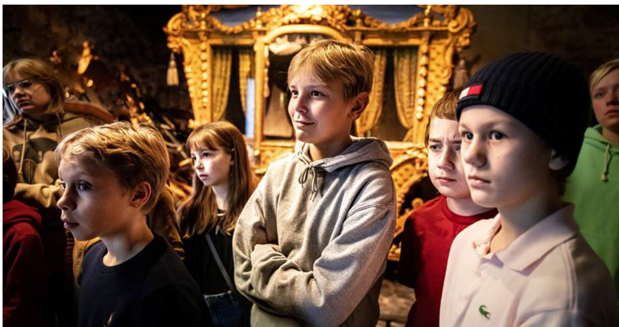
Barn på visning i Livrustkammarens återinvigda Vagnhall.