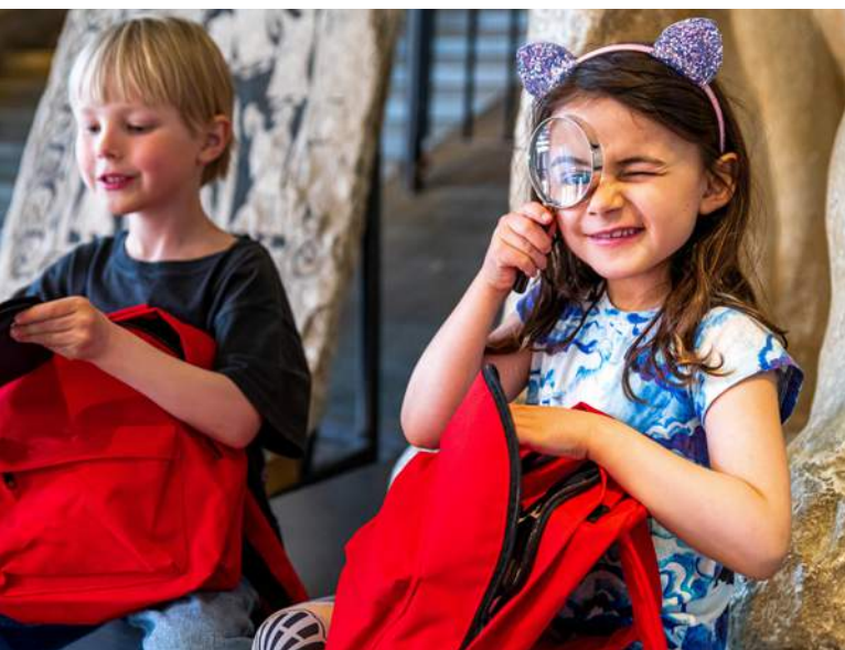
Äventyrsryggsäcken – ett nytt sätt för barn att upptäcka Historiska museet på egen hand.