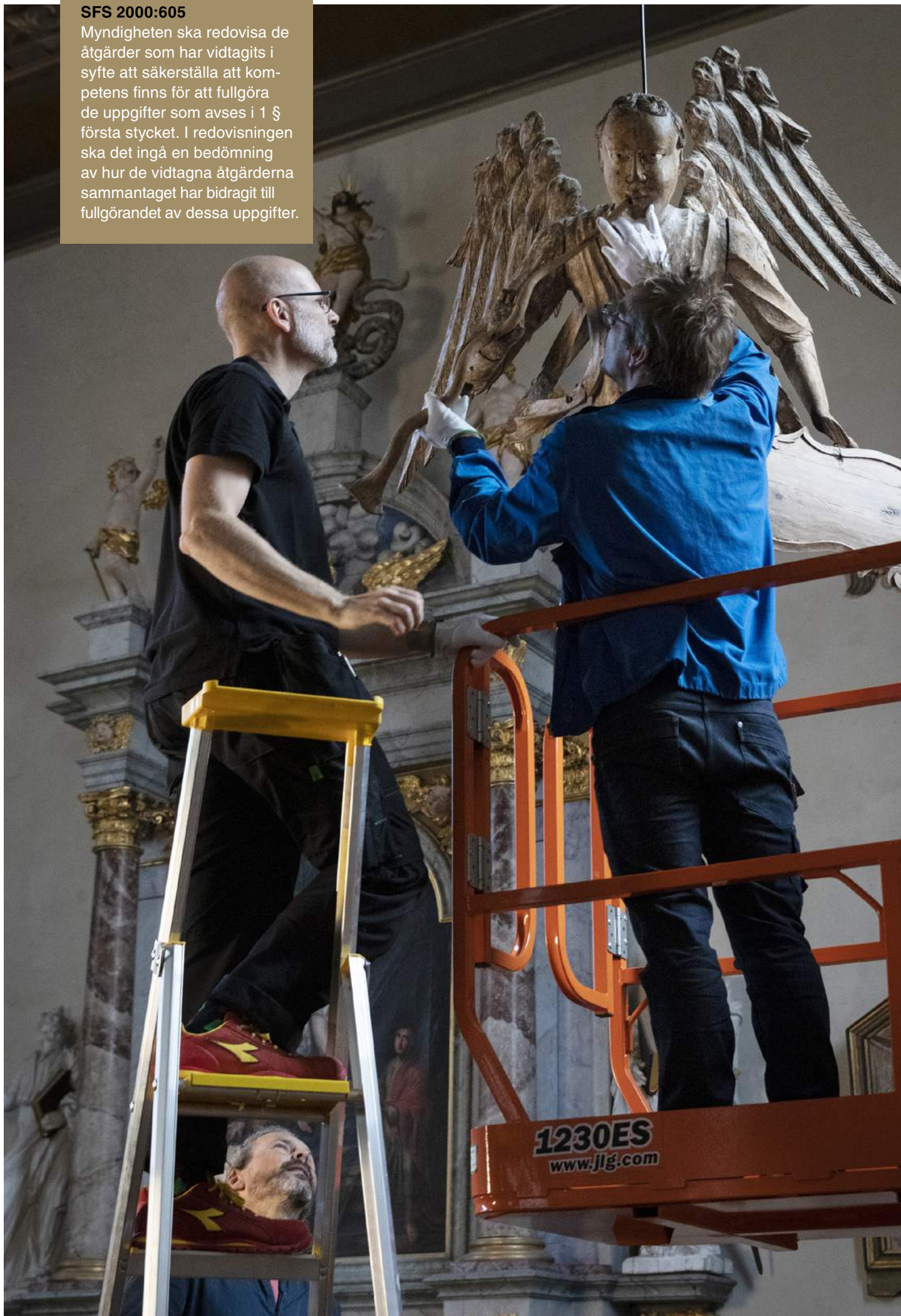
Upphängning av basunängeln från Ransätters kyrka på Historiska museet.

Myndigheten ska redovisa de åtgärder som har vidtagits i syfte att säkerställa att kompetens finns för att fullgöra de uppgifter som avses i 1 § första stycket. I redovisningen ska det ingå en bedömning av hur de vidtagna åtgärderna sammantaget har bidragit till fullgörandet av dessa uppgifter.