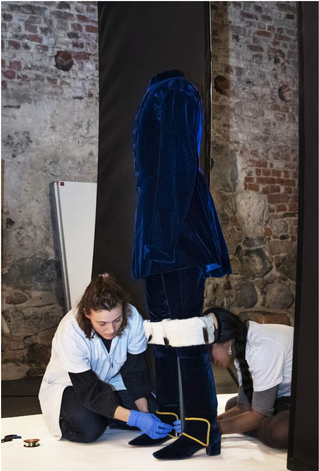
Förberedelse av Oscar I:s kröningsdräkt för fotografering till Manga Royals – Kunglig historia i mangastil . Foto: Amina Dahlab