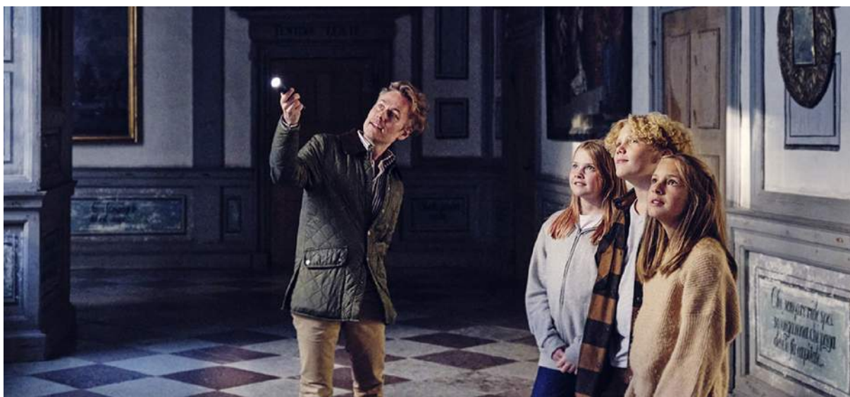
Visning i Skoklosters slott.