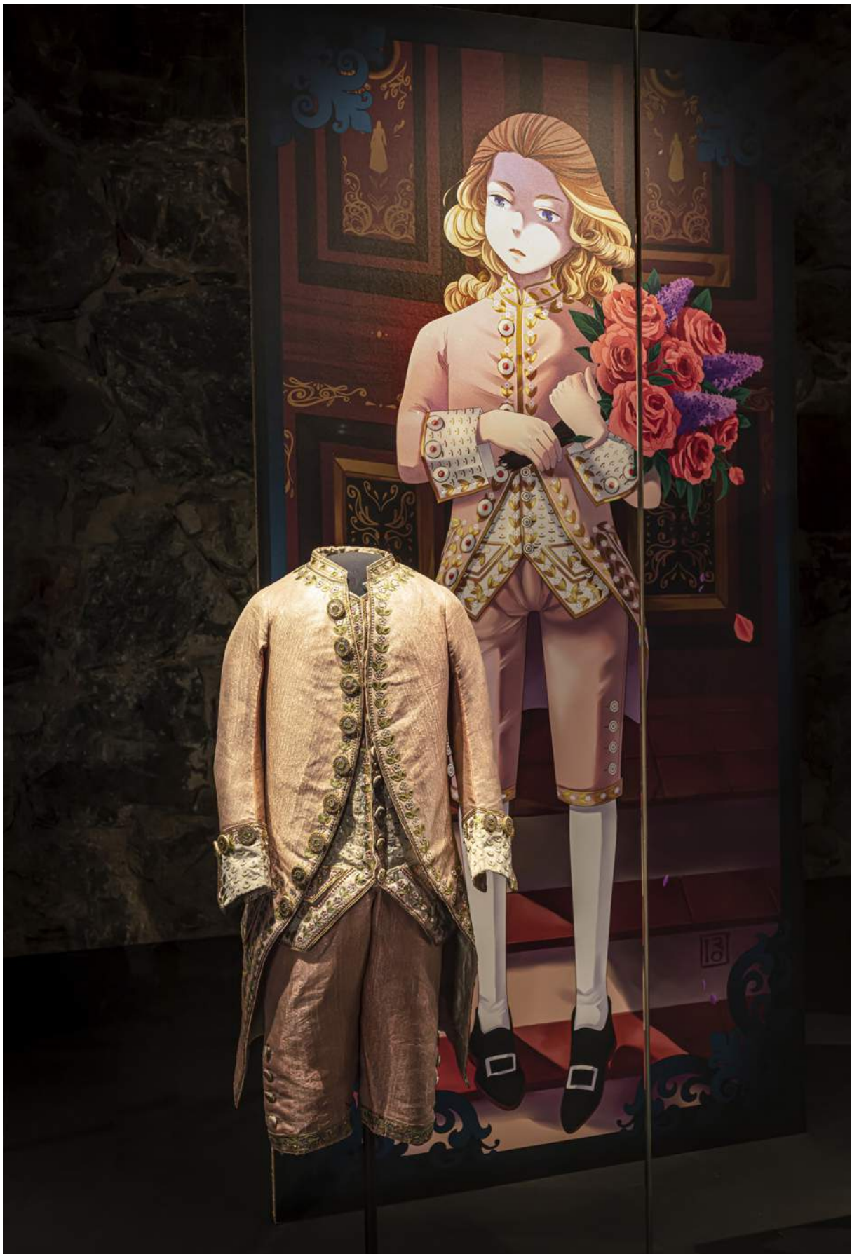
Tsar Alexanders sidendräkt i utställningen Manga Royals – Kunglig historia i mangastil på Livrustkammaren.