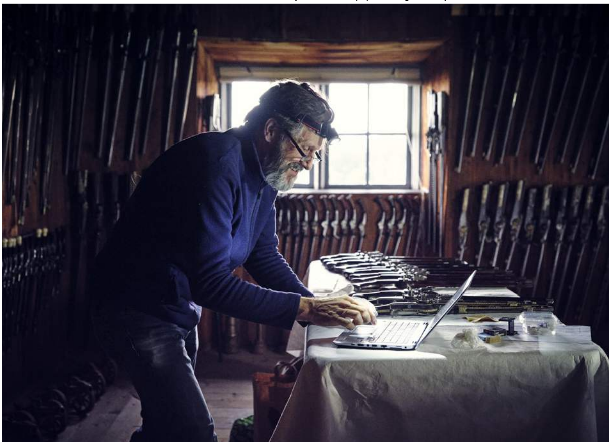
Rengöring, konditionsbedömning och vård av föremål på Skoklosters slott.