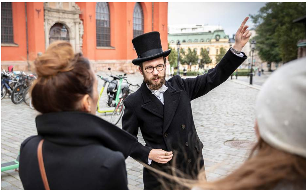
Hallwylska museets stadsvandring med tema Bekantskap sökes... berättar om anonyma kontaktytor i en tid då samkönade relationer var olagliga.