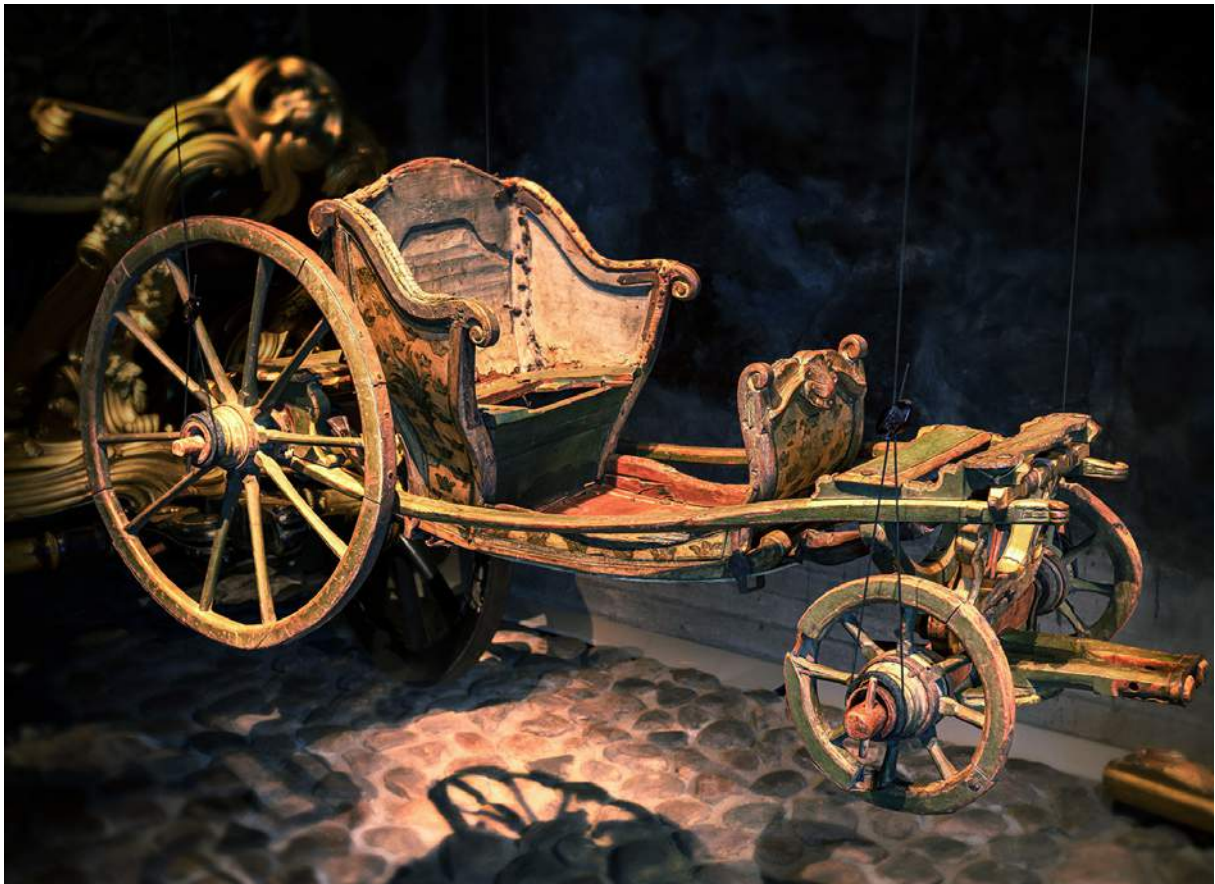
Kronprins Gustav (III):s lekvagn visas på Livrustkammaren.