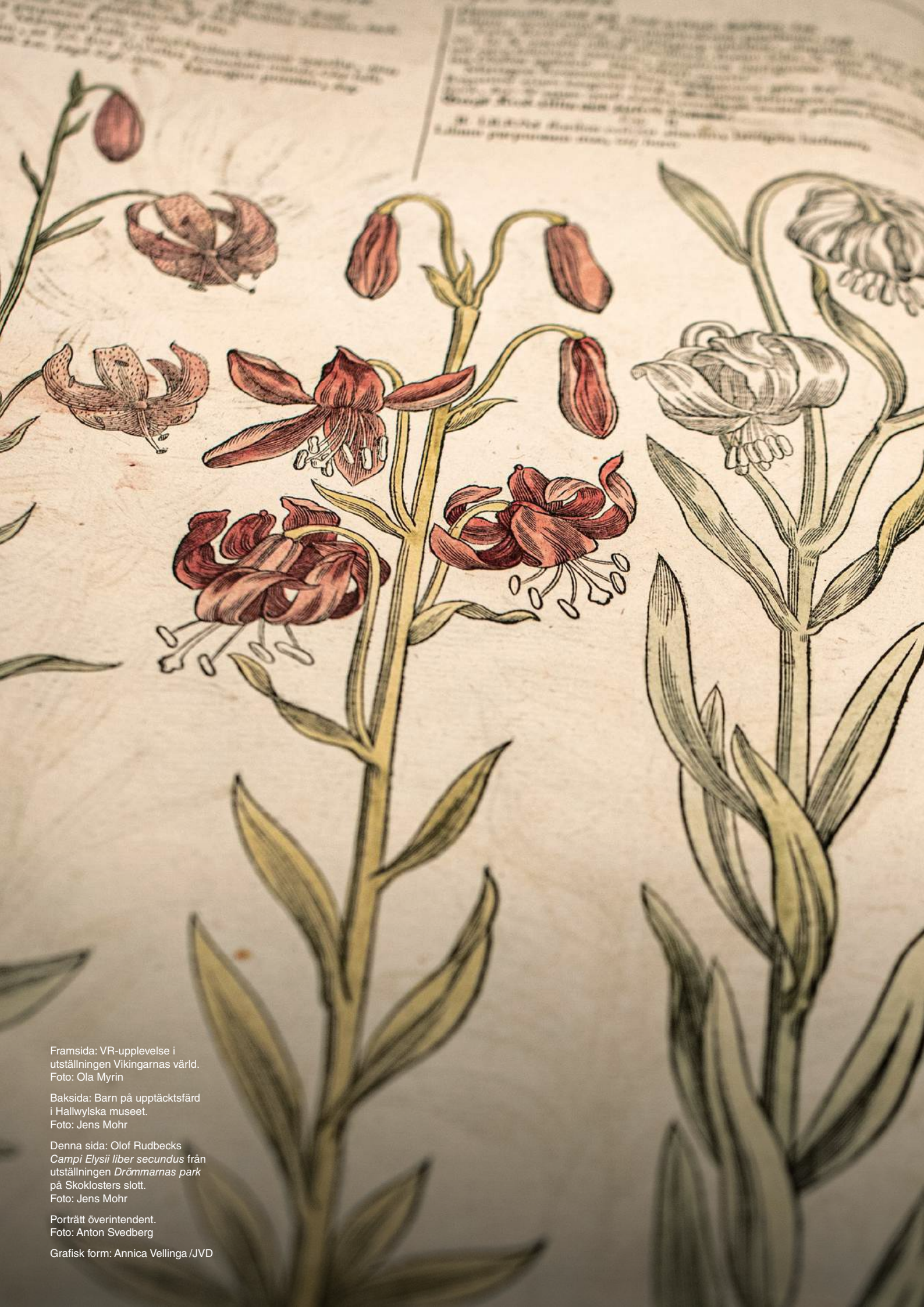
Framsida: VR-upplevelse i utställningen Vikingarnas värld.