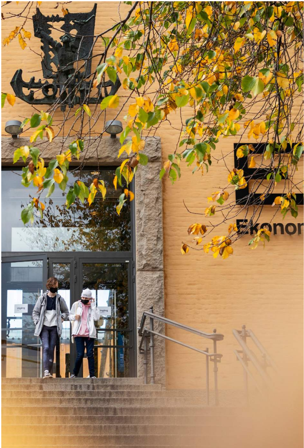
Besökare med munskydd lämnar Ekonomiska och Historiska museet på Narvavägen.