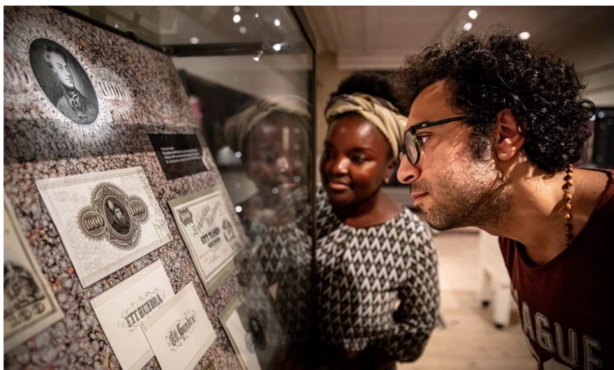
Besökare i utställningen Sedlarnas historia i Oxhuset på Tumba bruksmuseum.