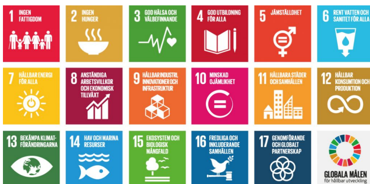
Fig. 1 Globala målen, Agenda 2030

FoU-programmet bygger på omvärlds- och närvärldsanalyser av samhällsförändringar och konsekvenser av dessa som på kort och lång sikt påverkar myndighetens verksamhet – och därigenom kunskapsbehoven.