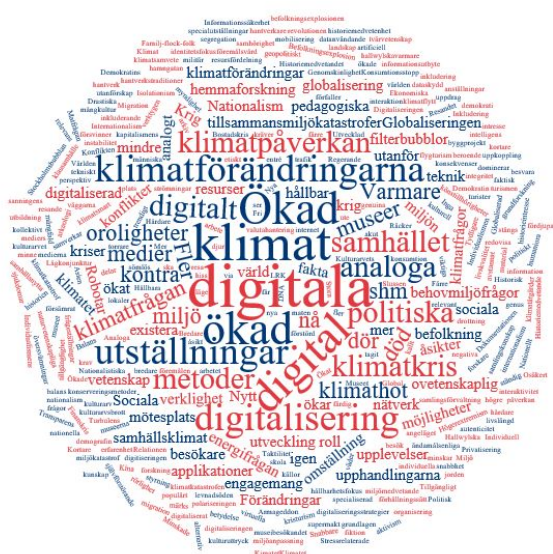
Fig. 2 Omvärlds- och närvärldsfrändringar som SHM:s medarbetare ser kommer att påverka myndigheten på tio års sikt.

Omvärldsanalysen i det europeiska samarbetet om kulturarvsforskning JPI Cultural Heritage and Global Change (JPI CH) 3 visar på fyra starka drivkrafter i omvärlden som påverkar framtida forskningsbehov. Dessa är: Turism och transport, Digitaliseringen av samhället, Socialt kapital samt Global migration och mobilitet (JPI CH 4 ). FoU-programmet är kopplat till JPI CH:s strategiska forsknings- och innovationsagenda 2020 5 och tar upp frågor om resiliens, hållbarhet samt klimat- och miljöförändringar.