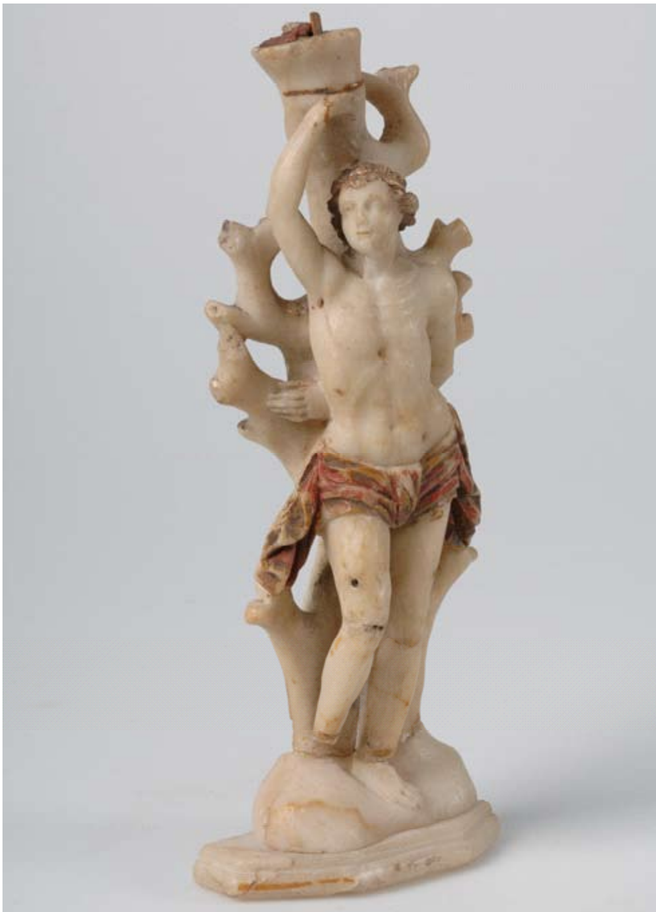
Figurin, den helige Sebastian. Ur Historiska museets samlingar.