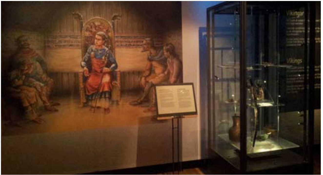
Genusmodifiering i Historiska museets utställning Vikingar.

Elevernas analys fokuserade på utställningens föremål och hur de presenterades, samt på utställningens bilder, deras motiv och placering. I analysen ingick även utställningens huvudberättelse/huvudpersoner, hur kvinnor och män beskrivs och vilka roller de tilldelas, samt hur utställningen beskriver/tar upp normer för kvinnligt och manligt under vikingatiden. Eleverna uppmanades också att välja ut bra och dåliga exempel i utställningen ur genussynpunkt.