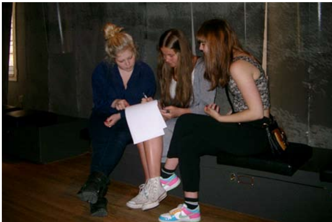
Gymnasieelever analyserar utställningar i Historiska museet.

Workshoparna på Hälsinglands museum var mycket uppskattade och utvärderingen visar genomgående att nya tankar väcktes som deltagarna tror kommer påverka deras fortsatta arbete. Effekterna ska följas upp i ett senare skede. Workshopkoncept och redovisning av erfarenheterna kommer att ingå i Jämus slutpublikation.