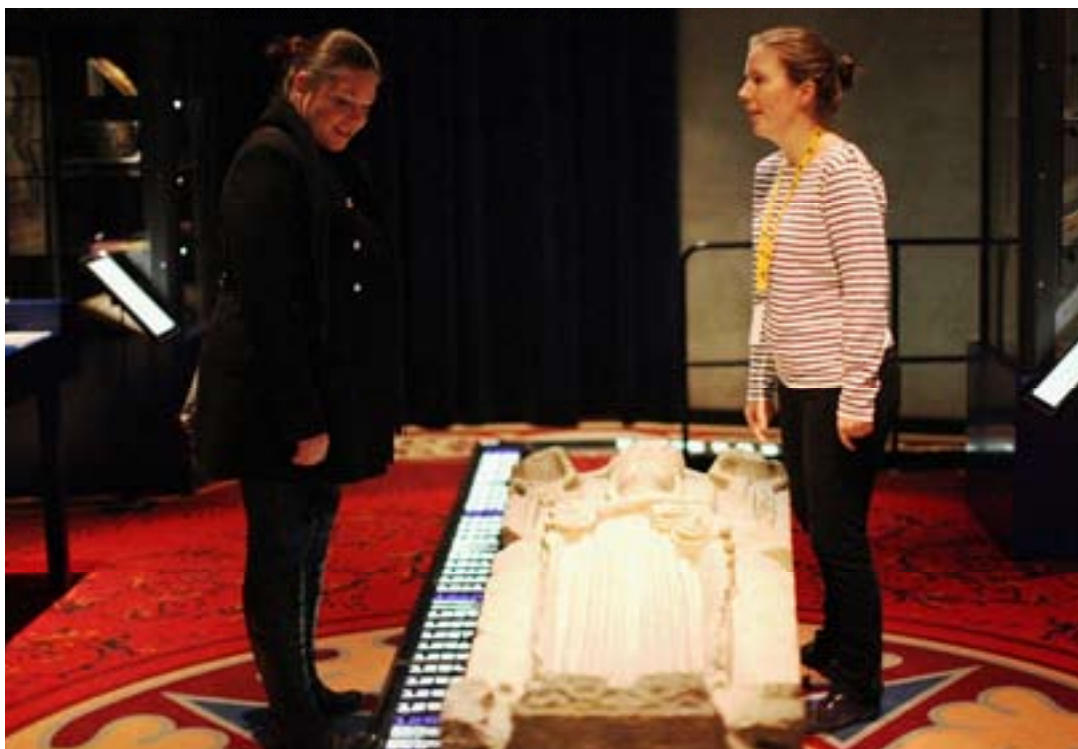
Guidning i Historiska museets utställning Sveriges historia. Foto av Ulf Bodin på Flickr. Licensierat CC BY-NC-SA 2.0